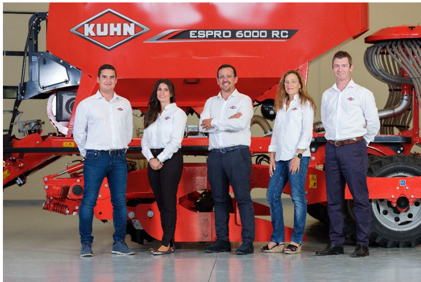
FOTO 1. NUEVO EQUIPO DIRECTIVO DE KUHN IBÉRICA.

El equipo de KUHN Ibérica siempre apostando por el talento