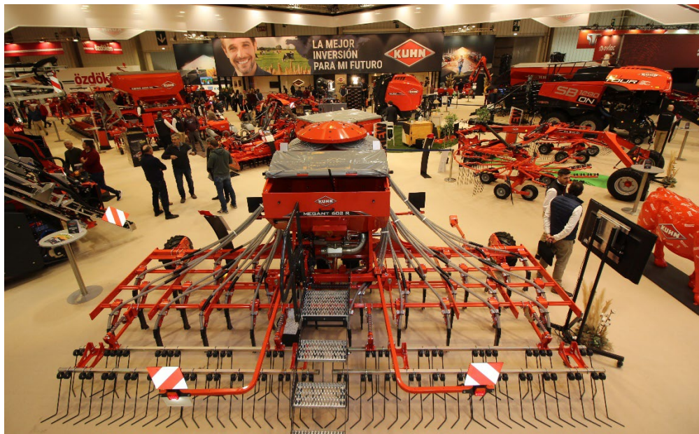
Sembradora suspendida para mínimo laboreo MEGANT 602 R