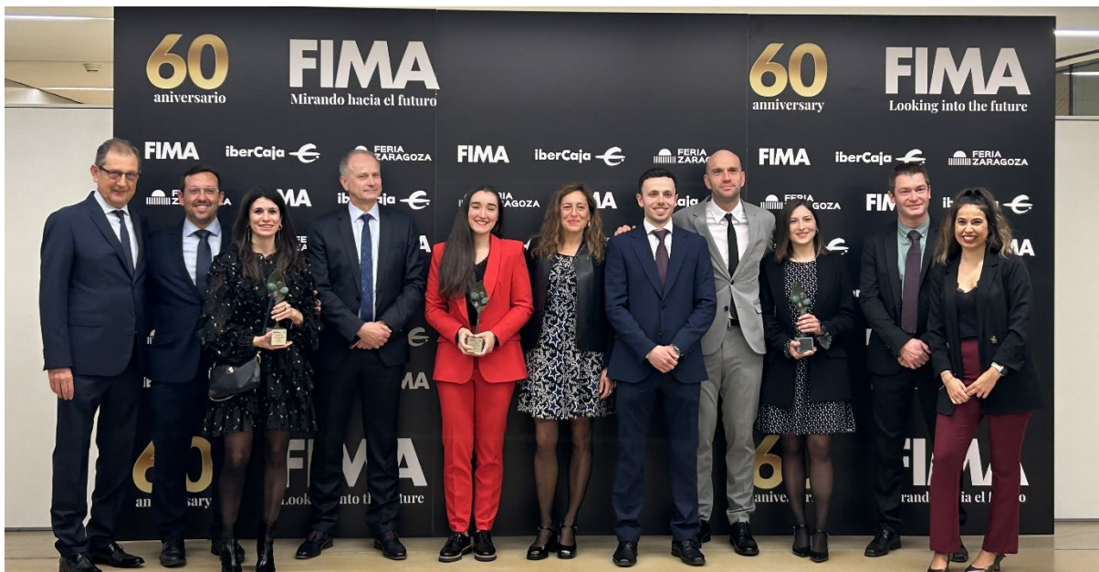
Parte del equipo KUHN Ibérica en la gala de premios de FIMA 2024