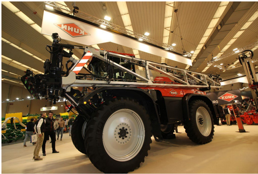
Nuevo pulverizador autopropulsado ARTEC F40 EVO