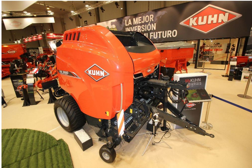
Nueva rotoempacadora de cámara variable VB 3260

Por otro lado, durante el pasado año 2023, KUHN Ibérica ha estado organizando múltiples eventos propios con motivo del 20º aniversario de la filial española. La FIMA ha sido una oportunidad para concluir el año de celebración, donde el pasado 13 de febrero se reunió de nuevo a la red de concesionarios para recordar la trayectoria de la filial bajo el lema “20 años juntos”.